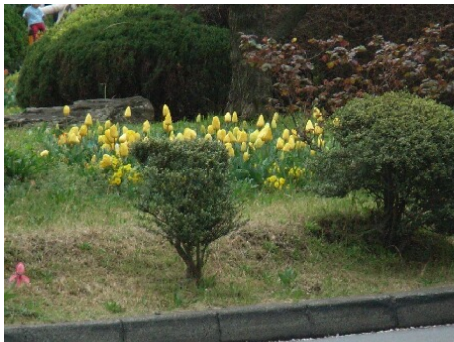
帰り道には満月が。。。