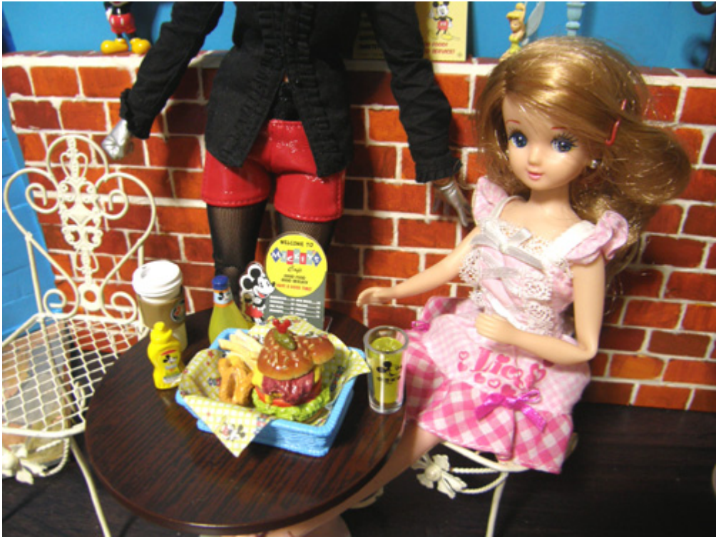
二人でおおきなハンバーガーバスケットを、注文したのだけれど。。