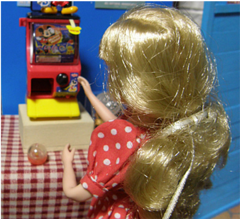
コインを入れてダイヤルをまわすと