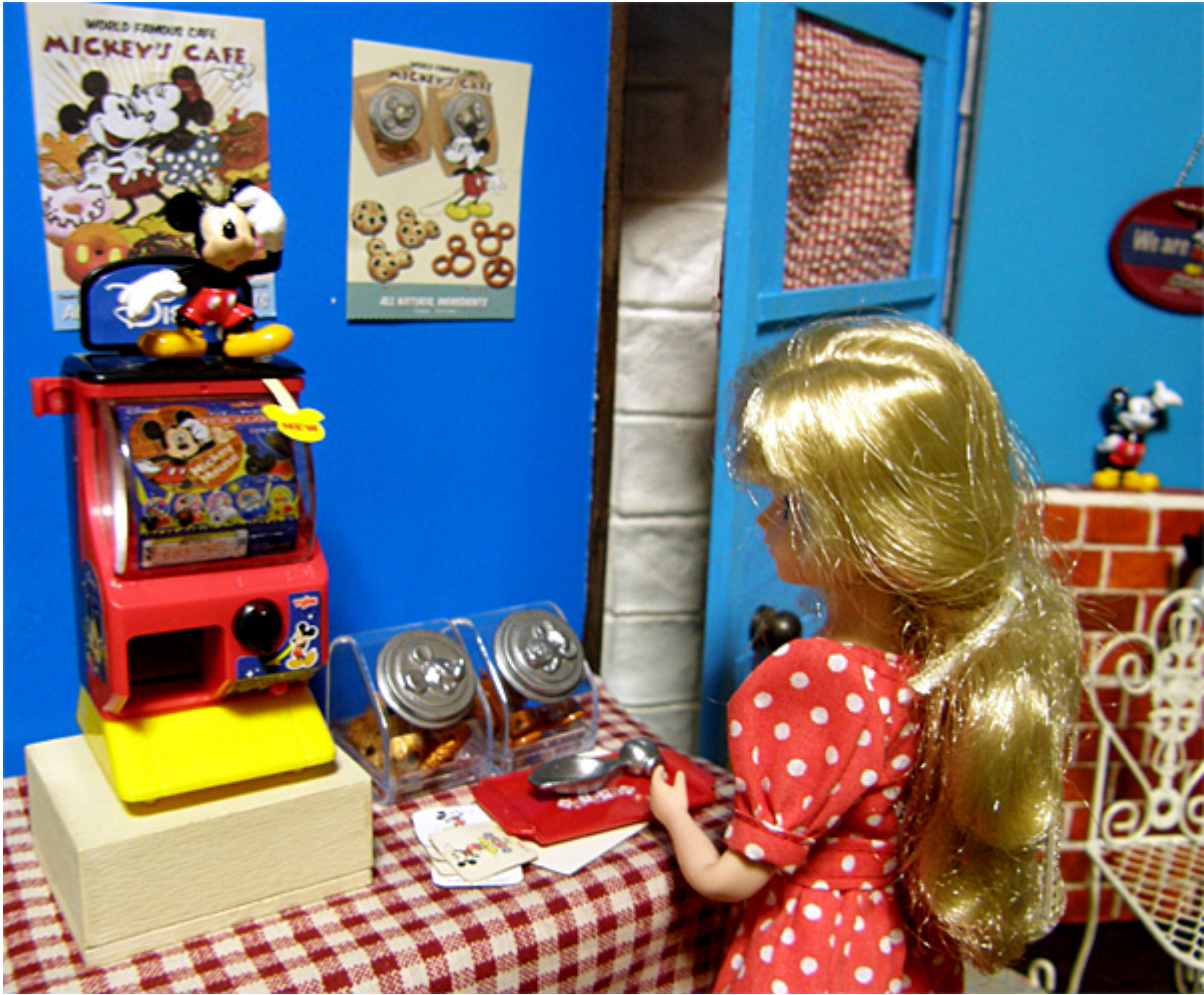
リカちゃんは、店の隅にある、ガシャポンマシンに気をとられている。