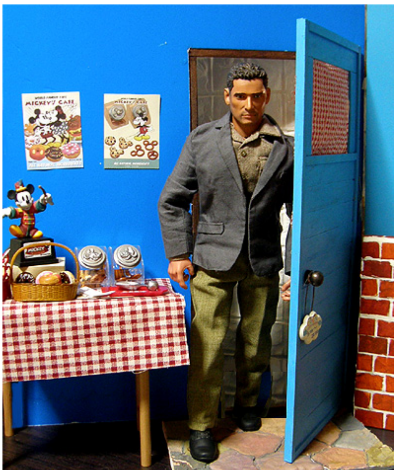
探偵がミッキーズカフェを訪れると、。。