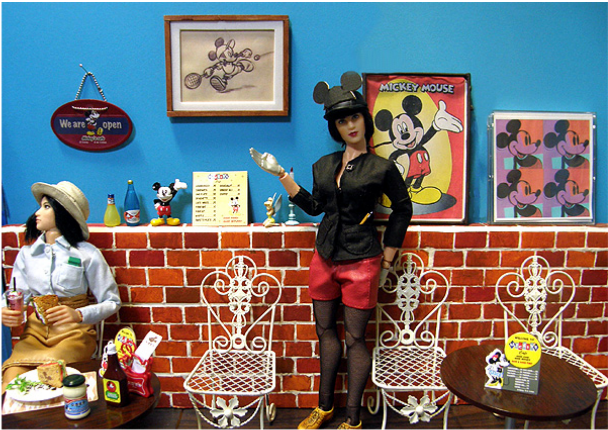
ポスターが増えました。