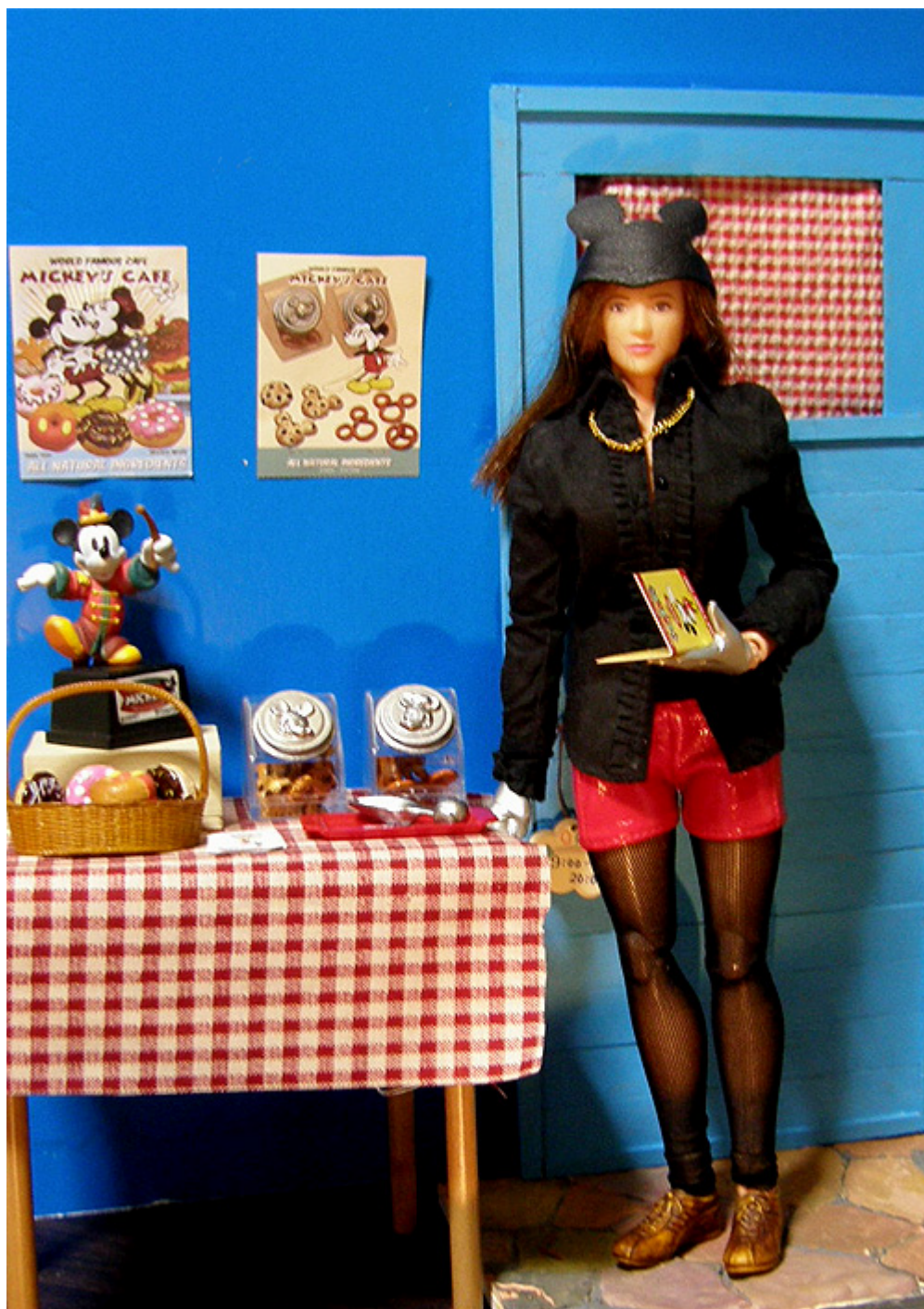
ここはミッキーズカフェ。