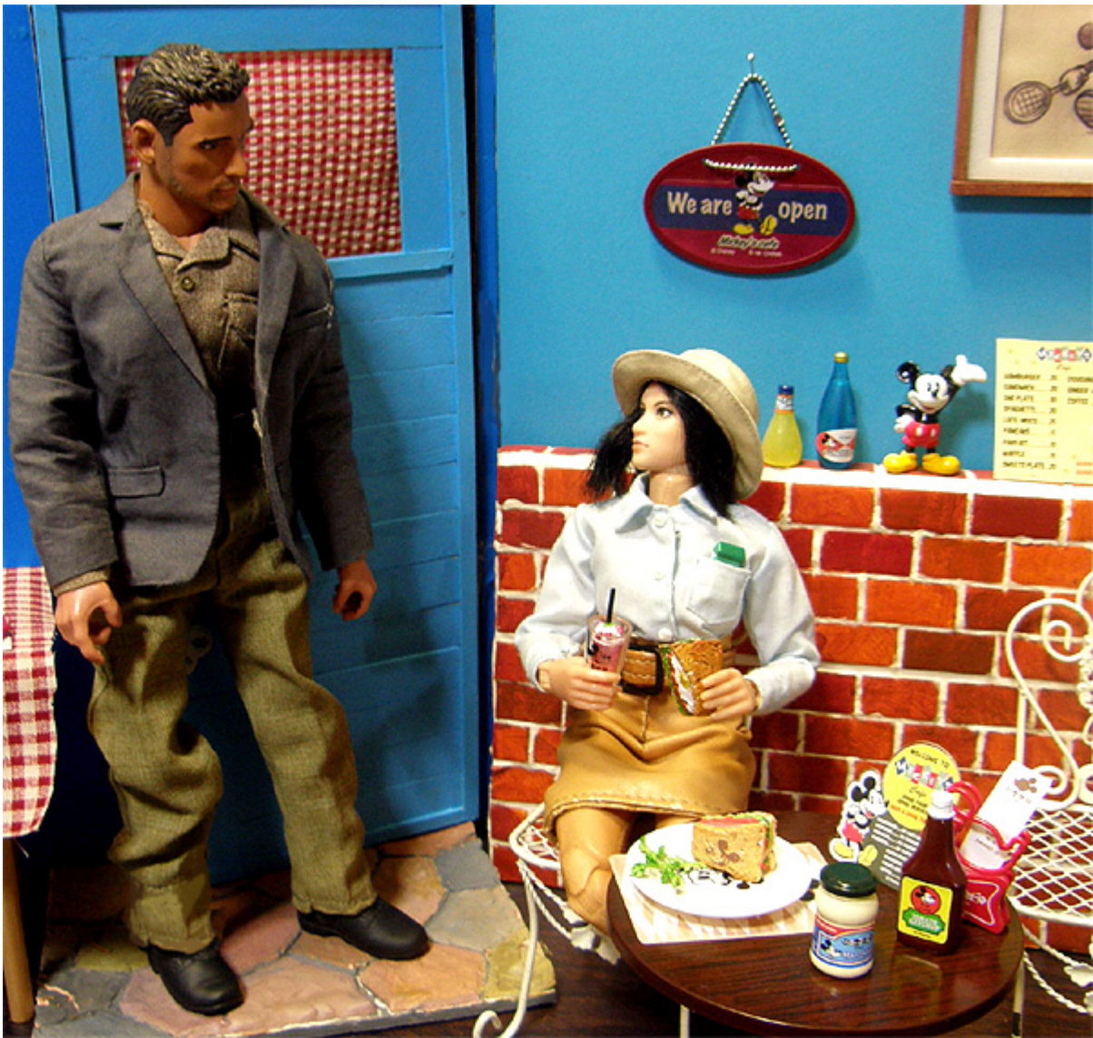
鷺尾翠がすでに来ていたのだった。